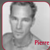
Pierre Ammann / Swiss